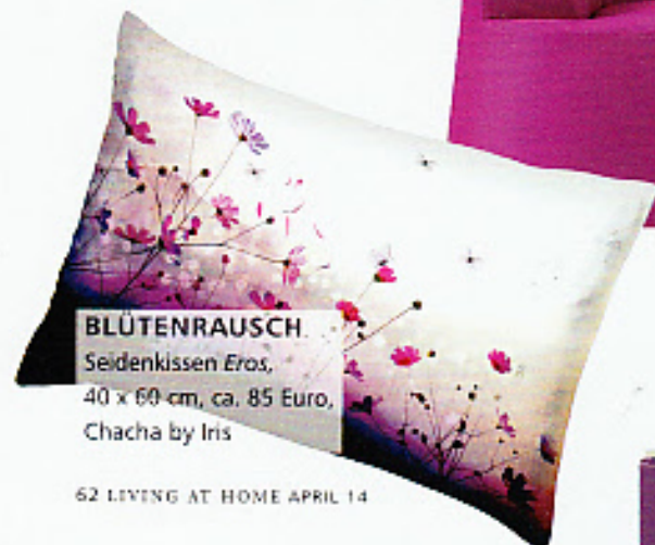
BLÜTENRAUSCH Seidenkissen Eros , 40 x 60 cm, ca. 85 Euro, Chacha by Iris