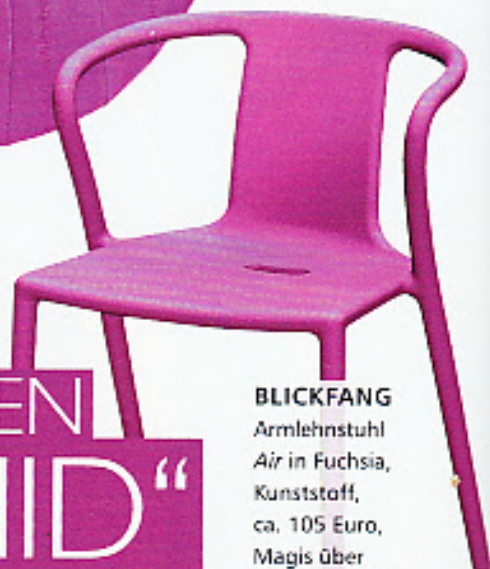
BLICKFANG Armlehnstuhl Air in Fuchsia, Kunststoff, ca. 105 Euro, Magis über madeindesign.de