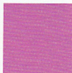
PANTONE® 18-3224 TPX Radiant Orchid

Die Pantone-Trendfarbe 2014 zieht uns mit exotischer Strahlkraft an