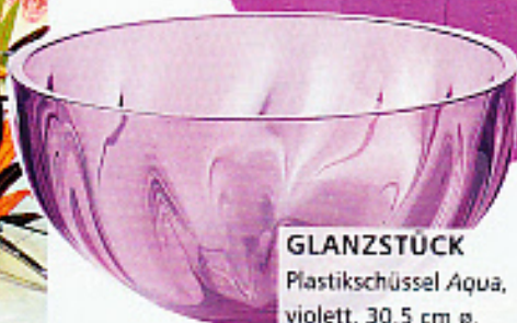
GLANZSTÜCK Plastikschüssel Aqua , violett, 30,5 cm ø, ca. 22 Euro, Guzzini