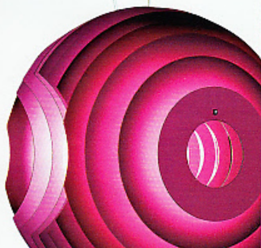
BLENDWERK Pendelleuchte Supernova aus Aluminium, pink lackiert, ca. 1240 Euro, Foscarini