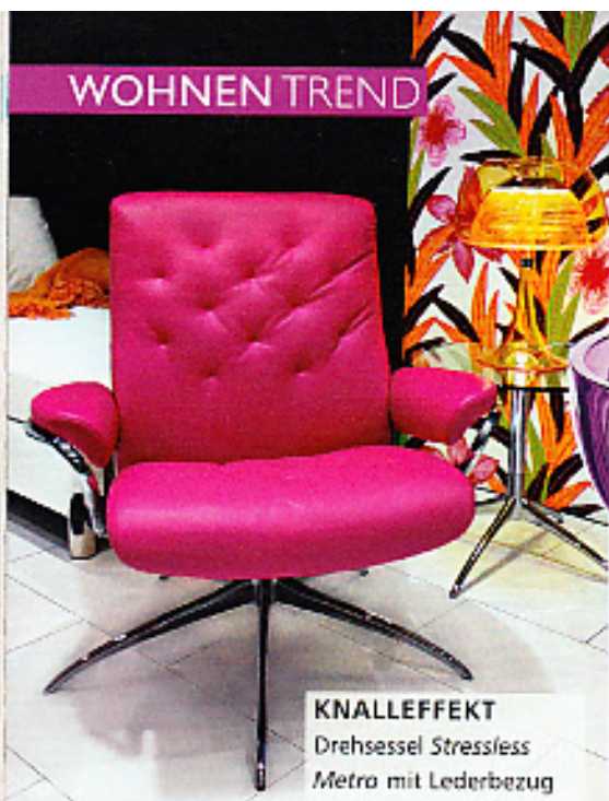
KNALLEFFEKT Drehstuhl Stressless Metro mit Lederbezug in Orchideenpink, ab ca. 1400 Euro, Ekornes