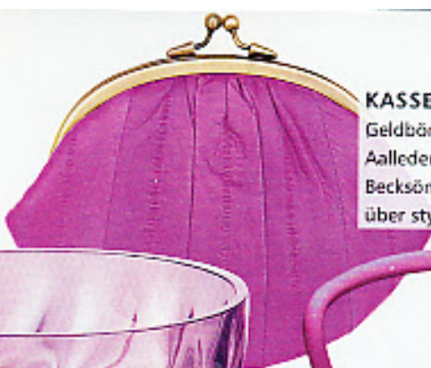
KASSENMAGNET Geldbörse Granny , Aalleder, ca. 45 Euro, Becksöndergaard über styleserver.de