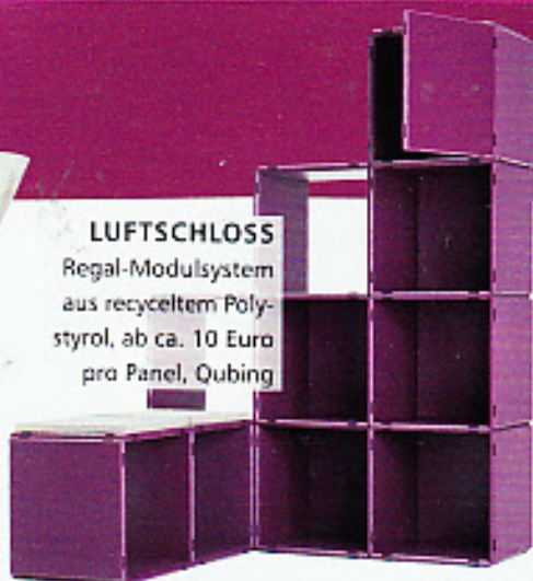
LUFTSCHLOSS Regal-Modulsystem aus recyceltem Polystyrol, ab ca. 10 Euro pro Panel, Qubing